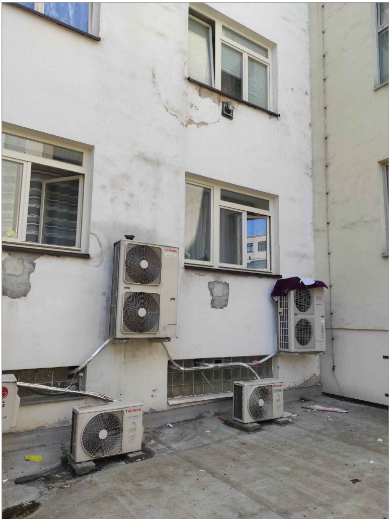
FOTOGRAFIE BYLY POŘÍZENY PŘI ZAMĚŘOVÁNÍ OBJEKTU, KTERÉ PROBĚHLO DNE 23. 6., 29. 7. A 25. 8. 2022